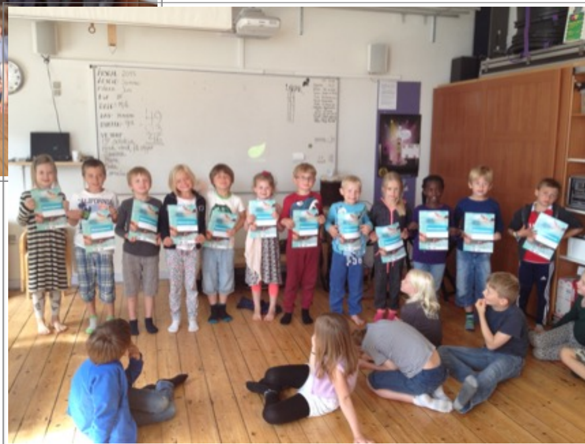
0. klasse får svømmediplomer.