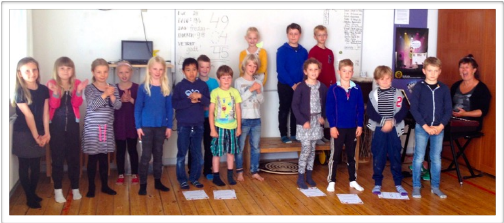
Farvel til 2. klasse...