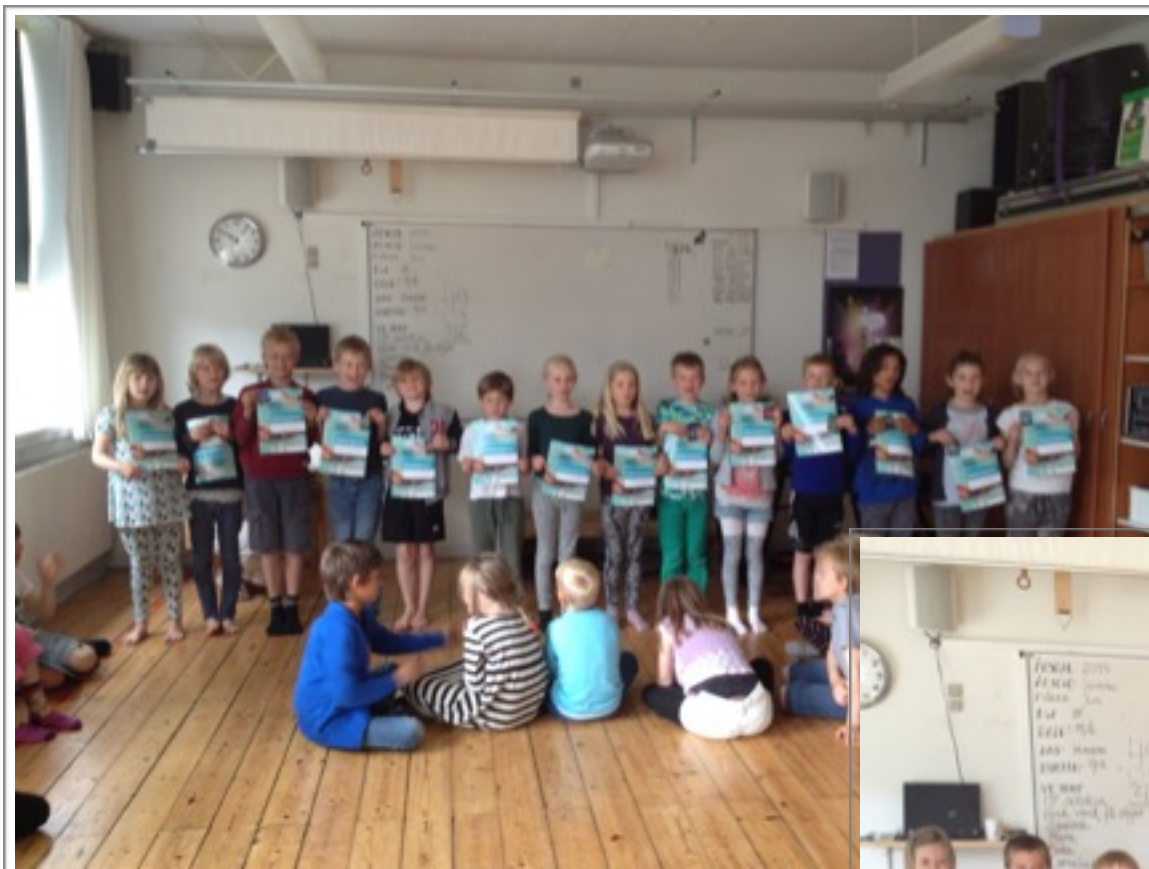
2. klasse får svømmediplomer.