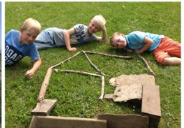
0. og 1. klasse har natur og teknologi ved Lumskebugten